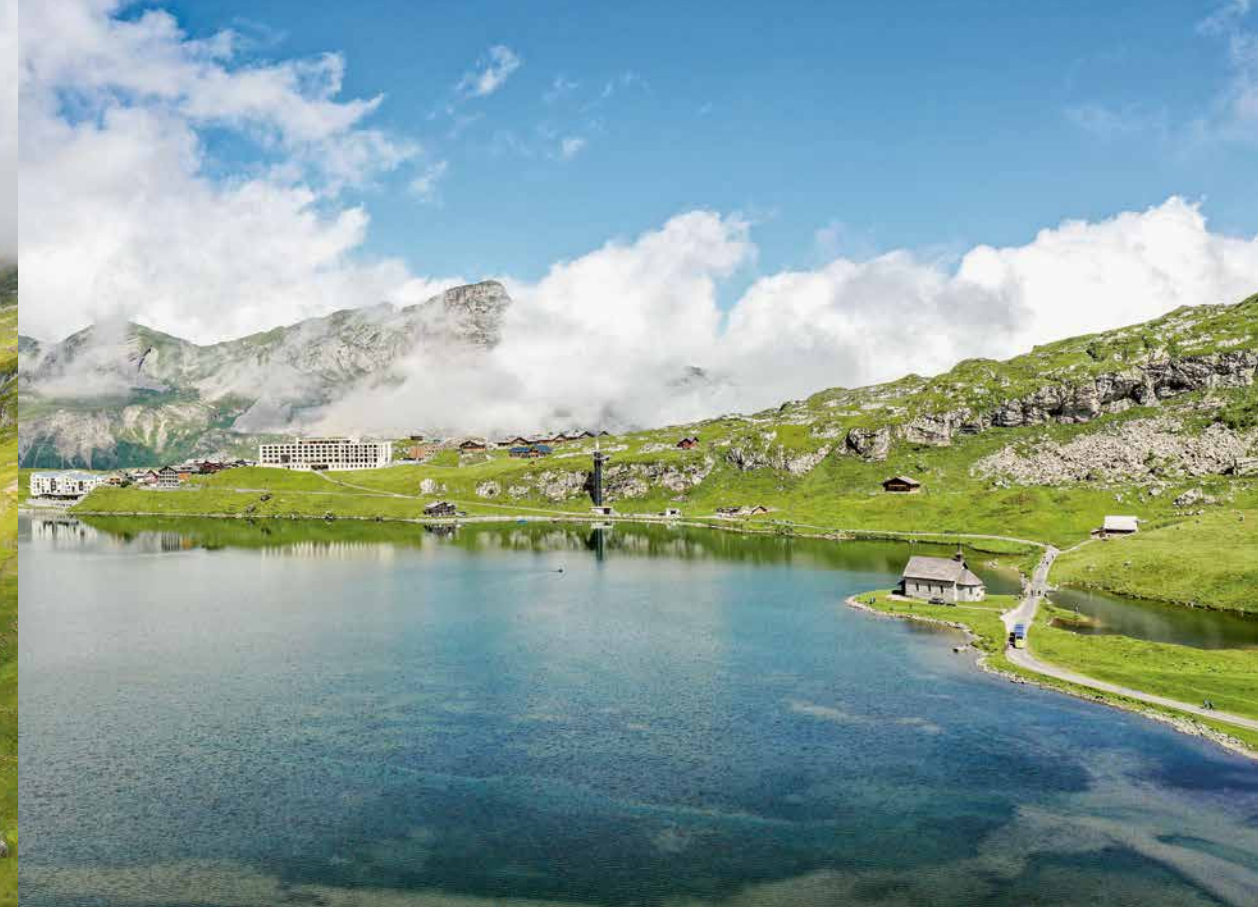
Melchsee-Frutt – Älgi 3 Std. – Käserstatt 6 Std. 10 Min.