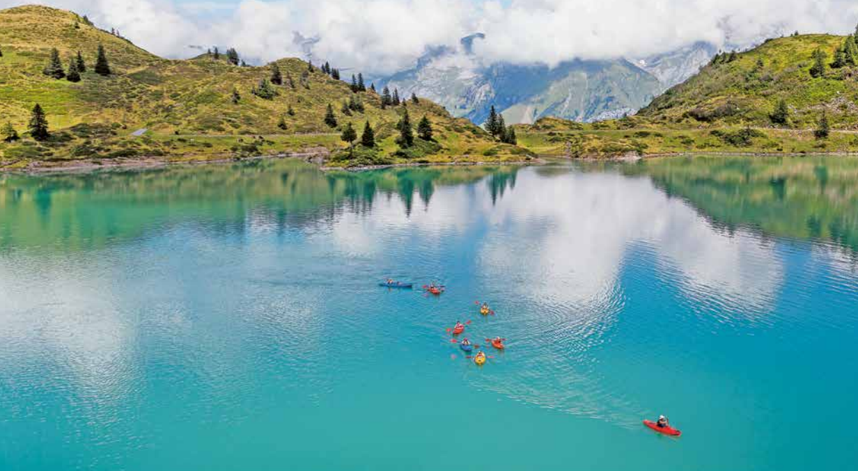
Engelberg – Jochpass 3 Std. 45 Min. – Engstlenalp 4 Std. 40 Min. – Melchsee-Frutt 6 Std. 30 Min.

Entlang der vier traumhaften Bergseen Trübsee, Engstlensee, Tannensee und Melchsee.