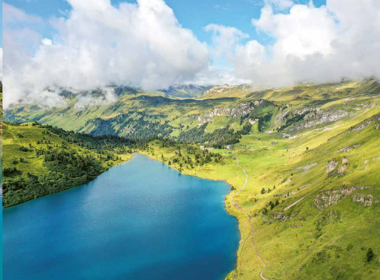
Käserstatt – Planplatten 2 Std. – Melchsee-Frutt 3 Std. 45 Min.